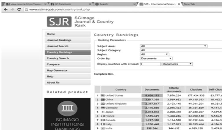
Gambar 2. Ranking urutan Scimagojr.com yang menempatkan Amerika Serikat sebagai negara yang penelitian dan publikasinya teratas di dunia

Pendidikan tinggi di Indonesia menghadapi tantangan yang sangat kompleks, salah satunya adalah kenyataan menurunnya kualitas penelitian dan publikasi di kalangan civitas akademika perguruan tinggi di Indonesia. Perguruan tinggi di Indonesia masih cenderung berorientasi pada pengajaran seperti halnya sekolah menengah atau sekolah dasar, belum ada upaya serius untuk mengejar ketinggalan dalam hal riset dan publikasi.